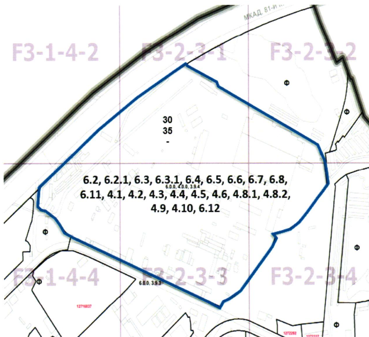
Схема границ территории, расположенной в производственной зоне № 46 «Коровино» (промышленная зона 46-I), в отношении которой принято решение о комплексном развитии территории по инициативе Правительства Москвы, на фрагменте карты границ территориальных зон Правил землепользования и застройки города Москвы